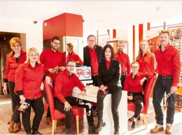
Das Team von Optiker Schnurbusch freut sich auf Sie!