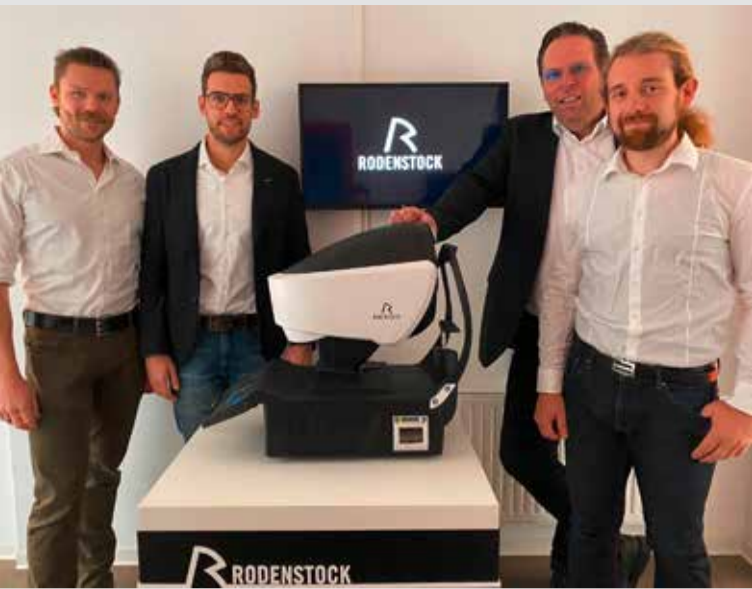
Das Meisterteam vermisst Ihre Augen mit dem DNEye® Scanner von Rodenstock.